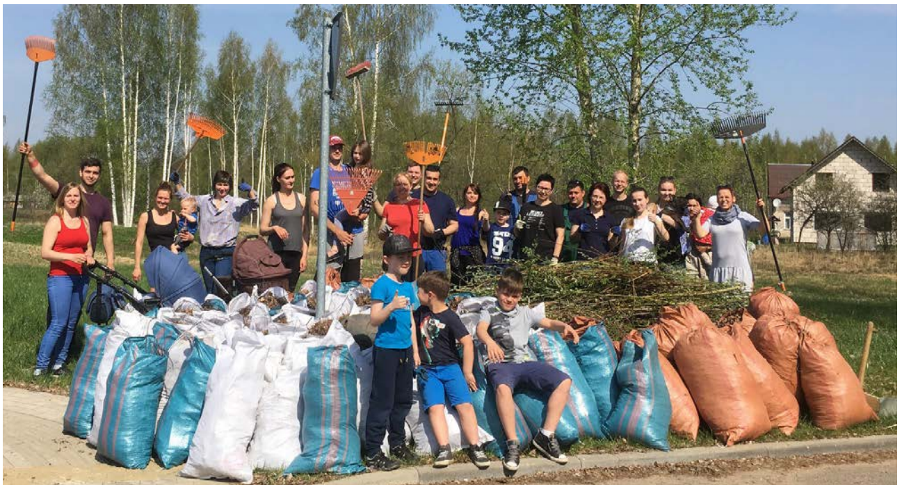
2019. gadā, piekto gadu pēc kārtas, AS VALMIERAS STIKLA ŠĶIEDRA kolektīvs kopā ar savām ģimenēm piedalījās vides sakopšanas iniciatīvā Lielā Talka, paralēli iesaistoties #TrashTagChallenge.

Pārbaužu rezultātā 2019. gadā no kontrolējošām institūcijām nav saņemti būtiski aizrādījumi vai sankcijas par GRUPAS uzņēmumu darbību. Regulāri tiek veikta virkne darbību ar saistīto tiešo risku monitoringu.