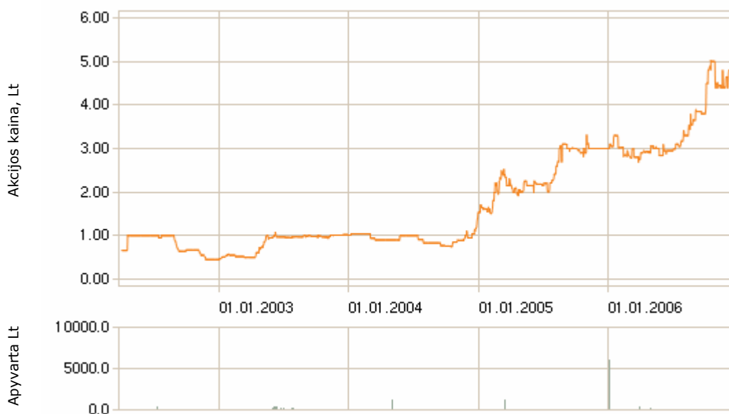
16.1. pav. Prekyba bendrovės akcijomis 2002-03-25 – 2006-12-31