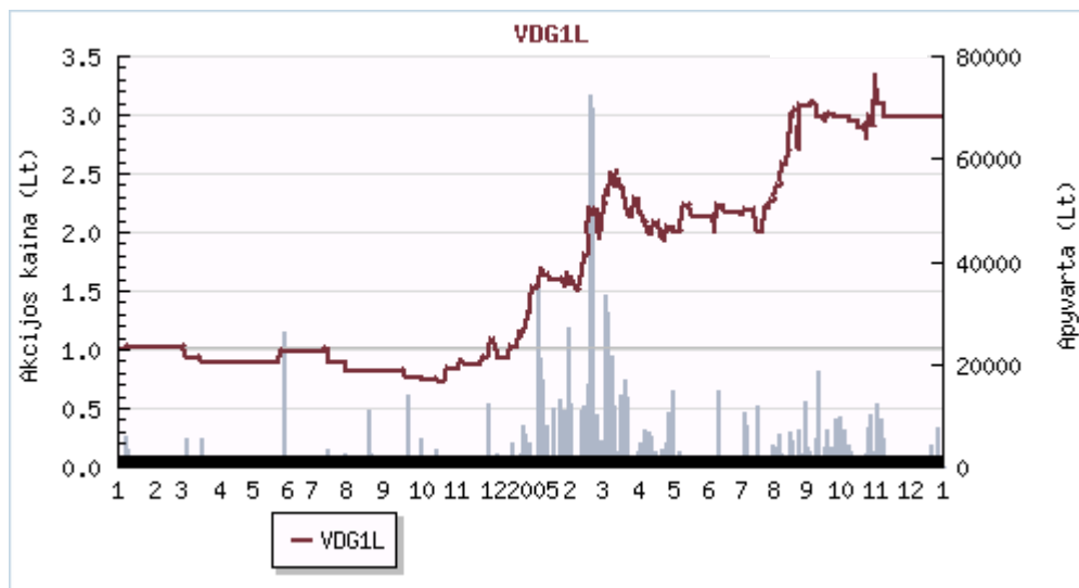
16.1. pav. Prekyba bendrovės akcijomis 2004-01-01 – 2005-12-31