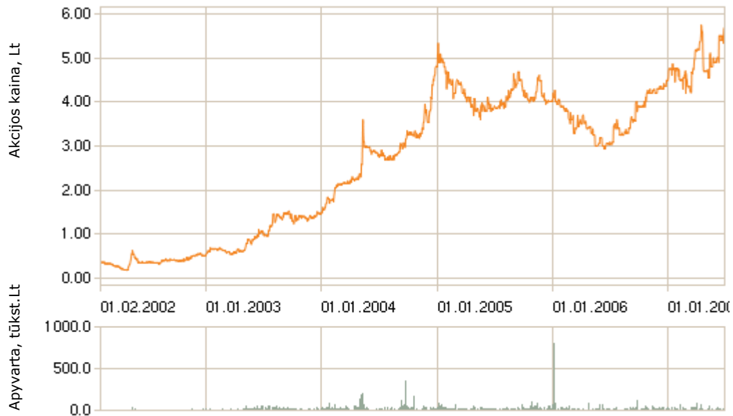
7.1. Pav. Prekyba bendrovės akcijomis (nuo prekybos pradžios)