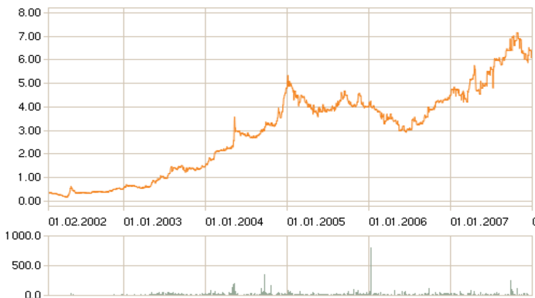
4.1. pav. Prekyba bendrovės akcijomis