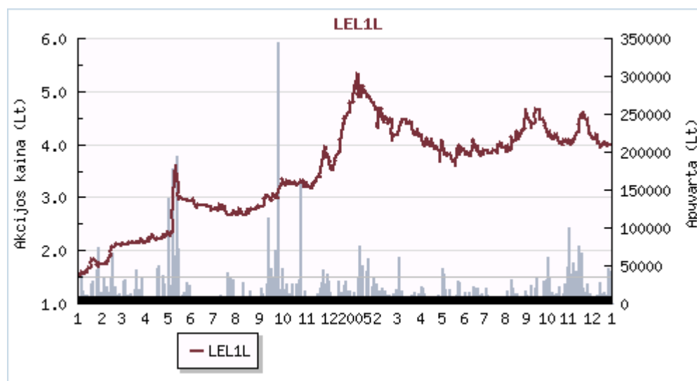
16.1. pav. Prekyba bendrovės akcijomis 2004-01-01 – 2005-12-31