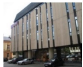
Biurų pastatas Vilniaus g. N.P. 6 200 m 2 Užimtumas – 97%