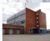
Biurų ir sandėlių patalpos Kirtimuose N.P. 2 500 m 2 Užimtumas – 94%