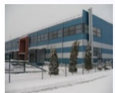
„Dommo business park“ N.P. 12 800 m 2 Užimtumas – 55%