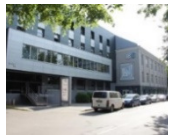
„IBC“ B klasės verslo centras N.P. 10 600 m 2 Užimtumas – 93%