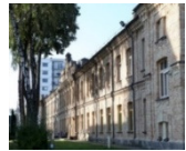
„Žygio verslo centras“ N.P. 2 600 m 2 Užimtumas – 100%