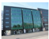
„IBC“ A klasės verslo centras N.P. 7 100 m 2 Užimtumas – 97%