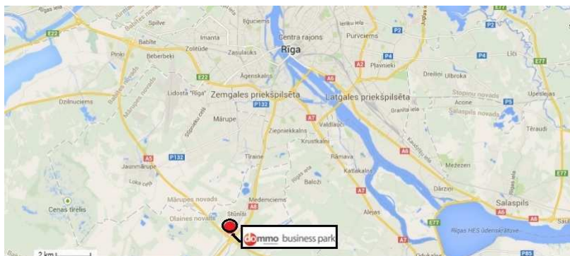
AB „INVL Baltic Real Estate“ įmonių grupės nekilnojamojo turto objektai Rygoje