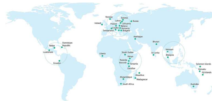
AB „INVL Technology“ valdomų įmonių veiklos geografija

„INVL Technology“ ketina siekti Lietuvos banko išduodamos uždaro tipo investicinės bendrovės licencijos (toliau – UTIB) ir savo esme tapti panašia į fondą.