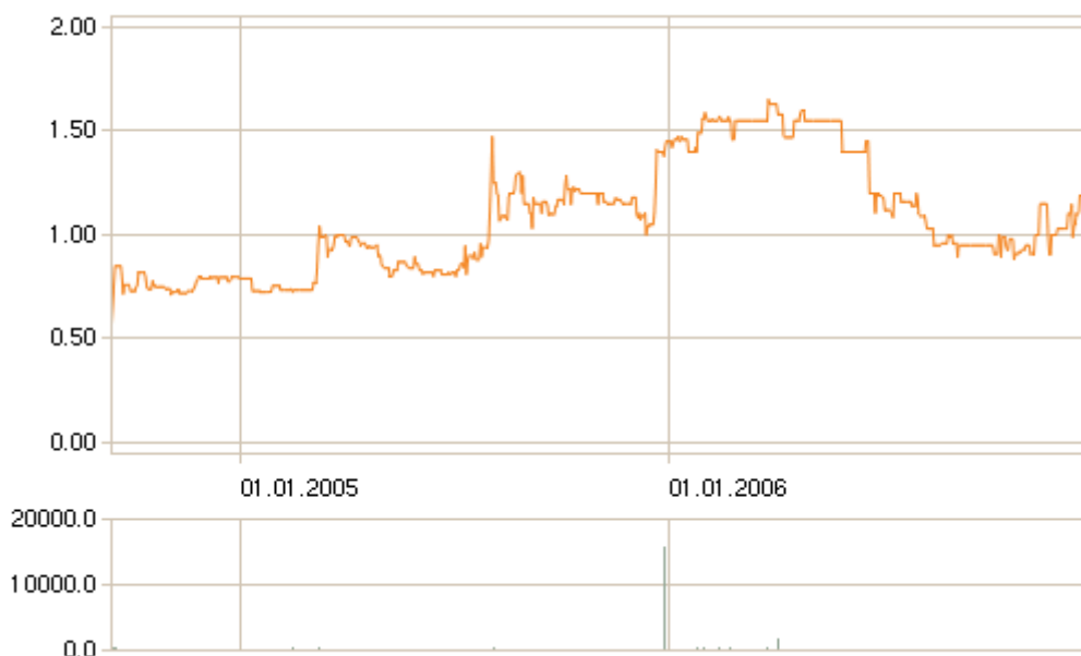
16.1. pav. Prekyba bendrovės akcijomis 2004-09-13 – 2006-12-31