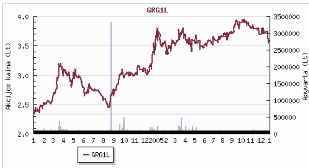
16.1. pav. Prekyba bendrovės akcijomis 2004-01-01 – 2005-12-31