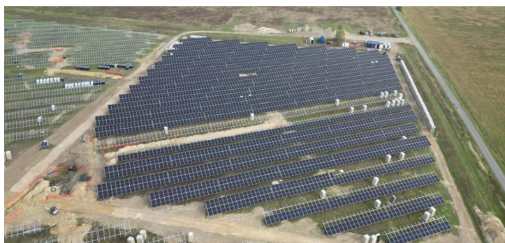
PV Energy Projects, saulės fotovoltiniai moduliai