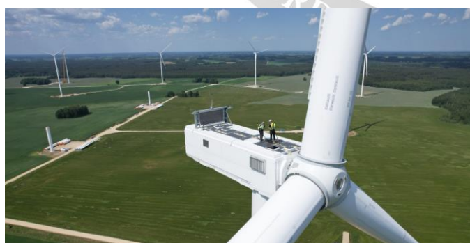
Rokiškio vėjo parko jėgainės