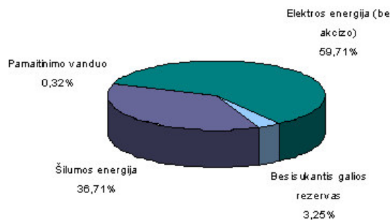
Gamybos apimtys 2002 m., proc.