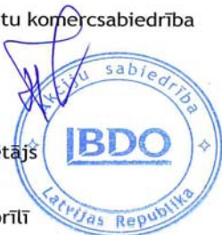
Aivars Putniņš LR zvērīnāts revidents Sertifikāts Nr. 123