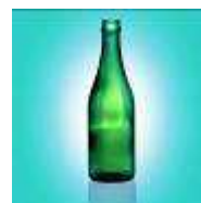
Потребительские товары массового спроса