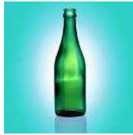
Потребительские товары массового спроса