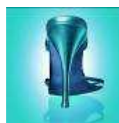
Неосновные потребительские товары