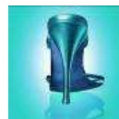
Неосновные потребительские товары