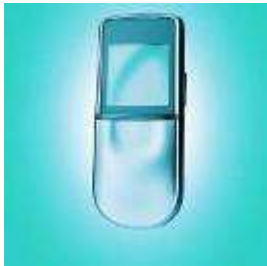
Предоставление телекоммуникационных услуг