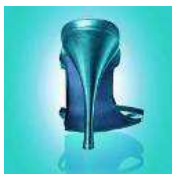
Неосновные потребительские товары