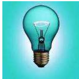
Предоставление коммунальных услуг